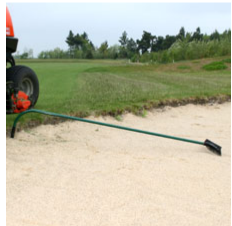
Sådan skal riverne placeres. Tænderne i "skudretningen" således at riven ikke stopper boldene og håndtaget ned i sandet.

Det er dårlig etikette, at gå mellem bunker og green på hul 5 og på hul 8. På herre teestedet på hul 9, bør man på stien venstre om teestedet med sin vogn. Husk: Nedslagsmærker og turf (forklaring skulle være unødvendig).