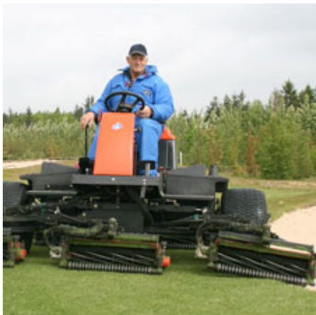
Op på maskinen, og videre til næste bunker, hvor riverne forhåbentlig ligger korrekt.