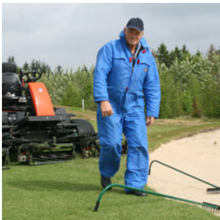
Derefter flyttes rive nr. 2, der ofte ligger i den anden side af bunkeren.