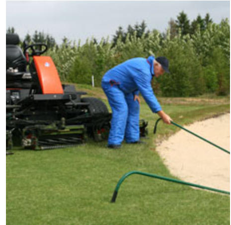
Slukker klipperen, ned af maskinen, hen og flytte rive nr. 1.