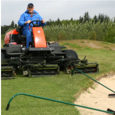
Riverne ligger med skaftet oppe på græsset!